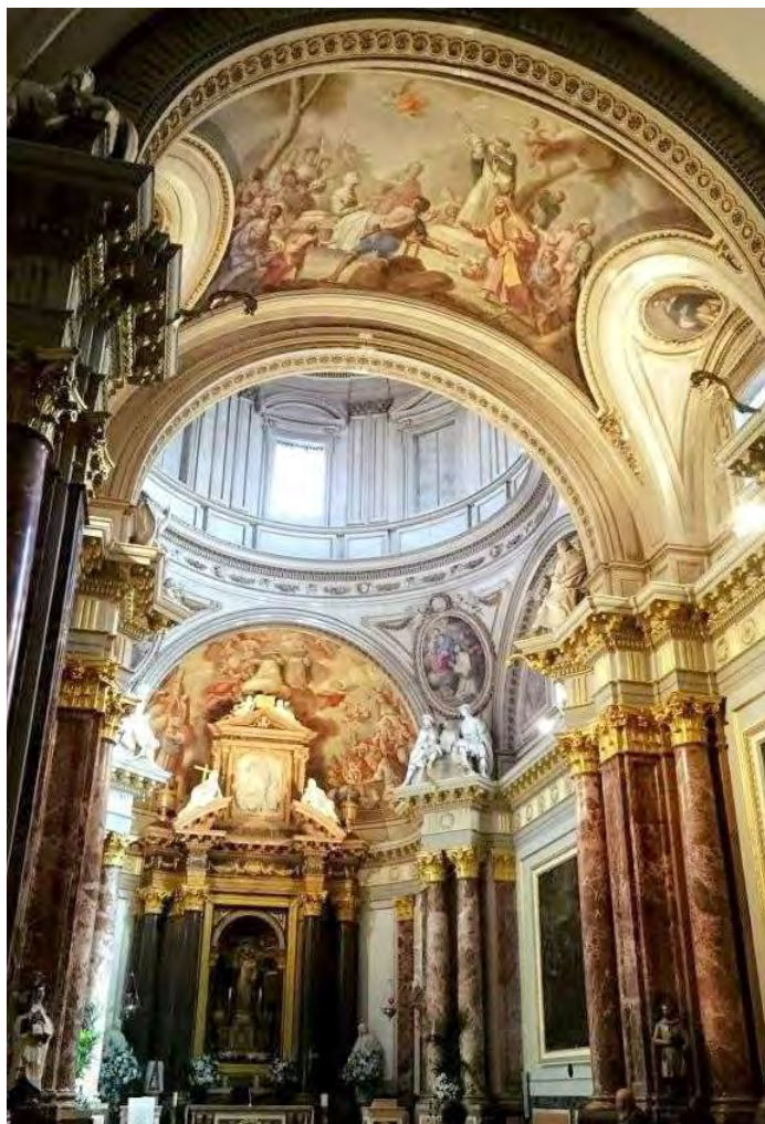
Interior Parroquia Castrense de Santo Domingo (Valencia)

Es presidente de la Academia de Historia Eclesiástica de Valencia.