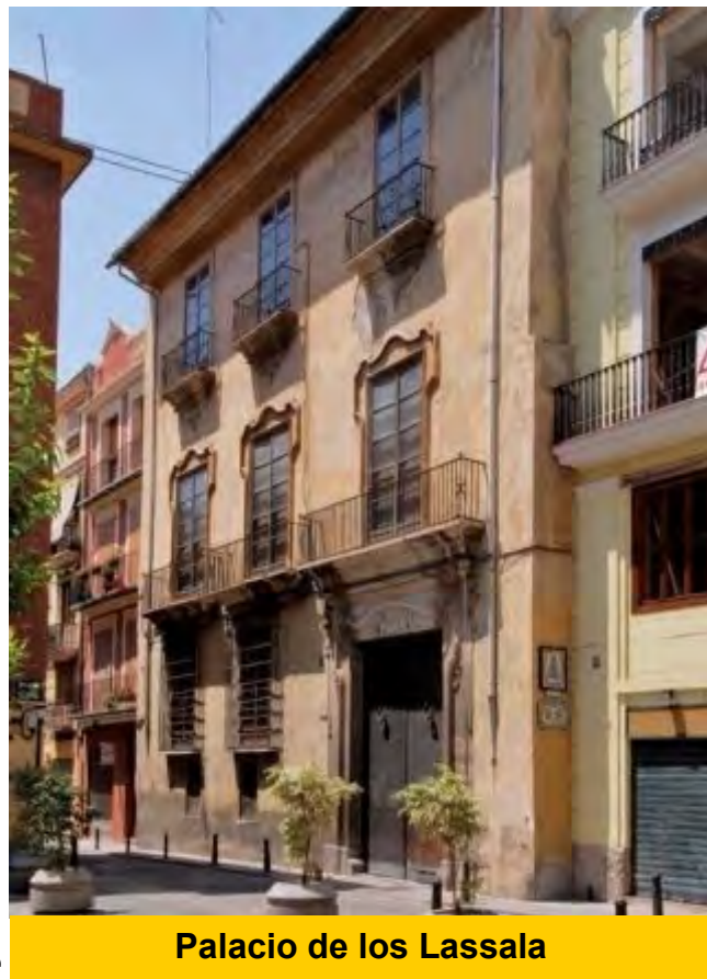
Palacio de los Lassala

“La profesión de la fe católica no se limita a tener una simple fe interior, privada, relegada al ámbito de la conciencia, sino que implica por necesidad, como la palabra profesión indica, que se haga confesión de la misma, es decir que se dé testimonio público de ella, tal como hemos escuchado en la primera lectura, donde los apóstoles, que han sido llevados ante el sanedrín por anunciar a Cristo, a pesar de la prohibición formal que las autoridades judías les habían hecho, son azotados por contravenirla y después puestos en libertad con la reiterada prohibición expresa de hablar de Jesús”.