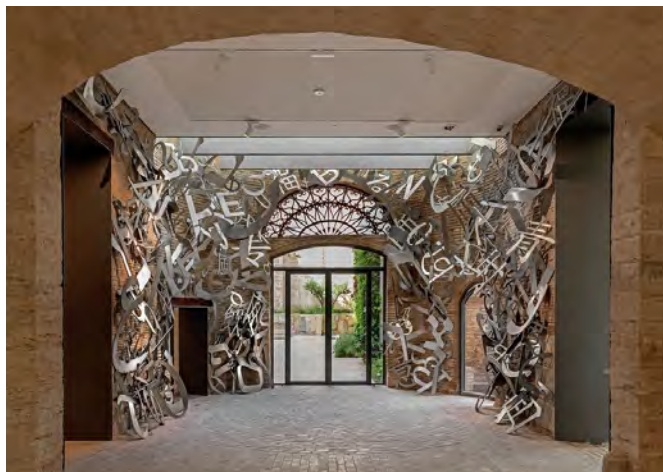
Museo Hortensia Herrero de Arte Contemporáneo