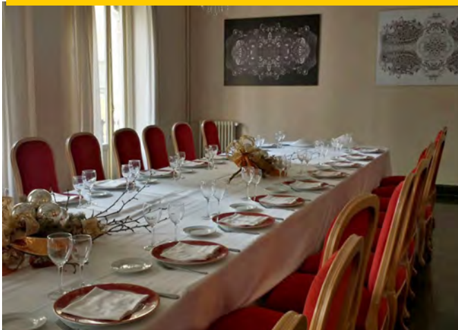
Real Sociedad Valenciana de Agricultura y Deportes