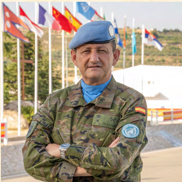
General de Brigada (R) Excmo. Sr. D. Ignacio de Olazábal Elorz

Es significativo resaltar que el día que SM el Rey asumió la Jefatura del Estado prestando juramento ante las Cortes Generales, escogiera el uniforme militar con las divisas de Capitán General del Ejército de Tierra para llevar a cabo el solemne acto de su proclamación.