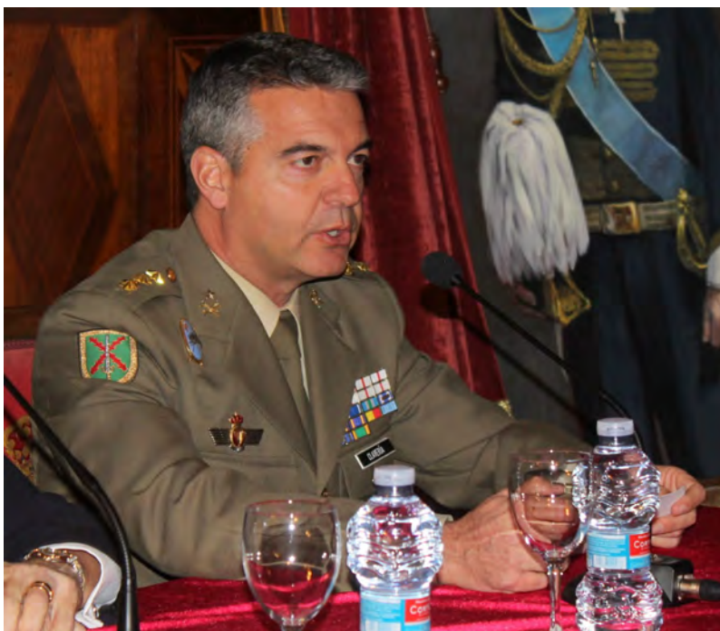
Coronel Jefe del RC “España” Nº 11