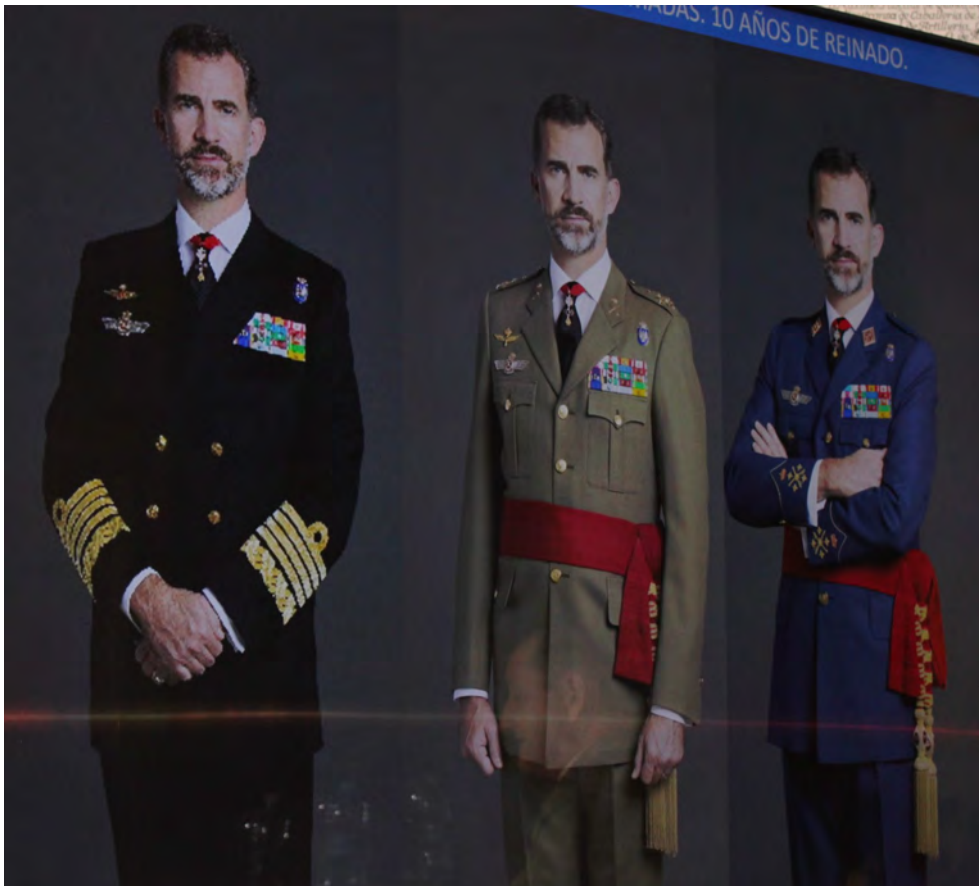
Su Majestad el Rey D. Felipe VI Mando Supremo de las Fuerzas Armadas

Como rezan nuestras Reales Ordenanzas, el militar desempeñará sus cometidos con estricto respeto el orden jerárquico militar en la estructura orgánica y operativa de las Fuerzas Armadas, que define la situación relativa entre sus miembros en cuanto concierne al mando, subordinación y responsabilidad.