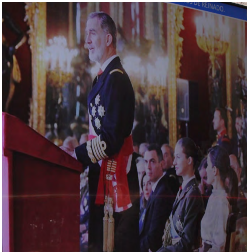
Imagen de Su Majestad el Rey Don Felipe VI

Así, en los uniformes de gala habitualmente utilizados en los actos más solemnes se aprecia en primer lugar la Venera con el Toisón y la Divisa Ducal pendiente de una cinta de seda roja a modo de corbata. Normalmente podemos distinguir también el Collar, la Banda o la Gran Cruz correspondientes a Gran Maestro de la Real y Distinguida Orden de Carlos III. Esta Orden, merece recordar que es la más alta condecoración civil del Estado y una de las más antiguas del mundo. Además veremos las tres Grandes Cruces, del Mérito Militar, Naval y Aeronáutico. En alguna ocasión, bordadas en la tabla del uniforme, Su Majestad