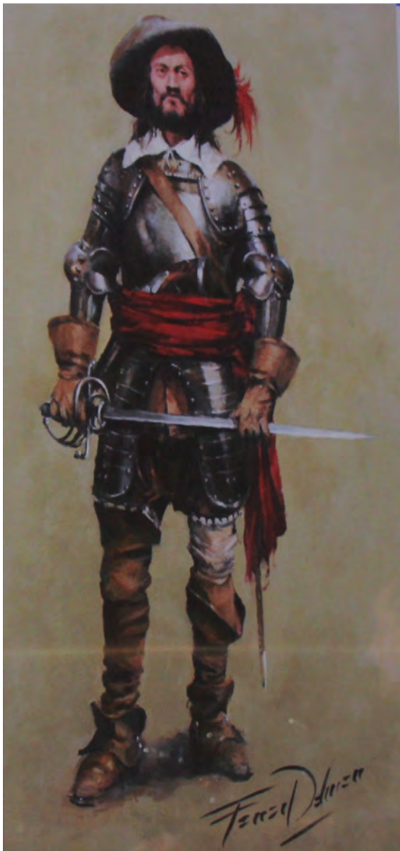
Pedro Calderón de la Barca

A lo largo de estas palabras pretendo detallar los diez años de reinado de Su Majestad el Rey abordando esta tarea desde la óptica militar, por ser nuestro ordenamiento legal, la misma Constitución de 1978, quien otorga al Jefe del Estado, el Rey, el Mando Supremo de las Fuerzas Armadas.