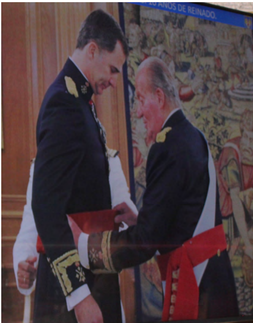
Su Majestad el Rey D. Juan Carlos impone a Don Felipe el fajín de Capitán general

Al Rey como Mando Supremo de las Fuerzas Armadas y primero de entre la jerarquía militar. Como bien es sabido, Su Majestad el Rey, al ser proclamado como tal por las Cortes Generales, asumió el Mando Supremo de las Fuerzas Armadas como Capitán General del Ejército de Tierra, de la Armada y del Ejército del Aire, llevando este empleo militar aparejados las señales, distintivos y atributos propios de un Capitán General, y que se muestran en el uniforme cuando ha sido visto. En el caso de los ejércitos, se aprecian los dos bastones de mando en aspa con las empuñaduras en lo bajo, acompañados en lo alto por la Corona Real. En cada uno de los ángulos del aspa se dispondrá una estrella de cuatro puntas, y otra estrella igual a las anteriores en el punto de cruce de los bastones. Como Capitán General de la Armada se distingue en su uniforme el entorchado y los cuatro Galones de catorce milímetros. Además portará el fajín carmesí.