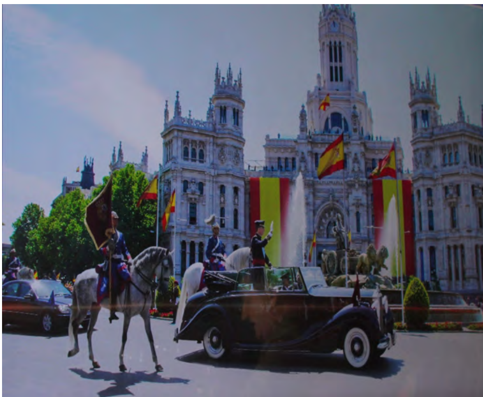
Su Majestad el Rey con Escuadrón de Escolta Real

Estas marcas que los Caballeros Nobles pintaran en sus escudos para ser reconocidos en el campo de batalla, tornaron hacia las banderas que hacían visible su posición en el combate y que dan origen a los signos y distintivos usados en la actualidad.