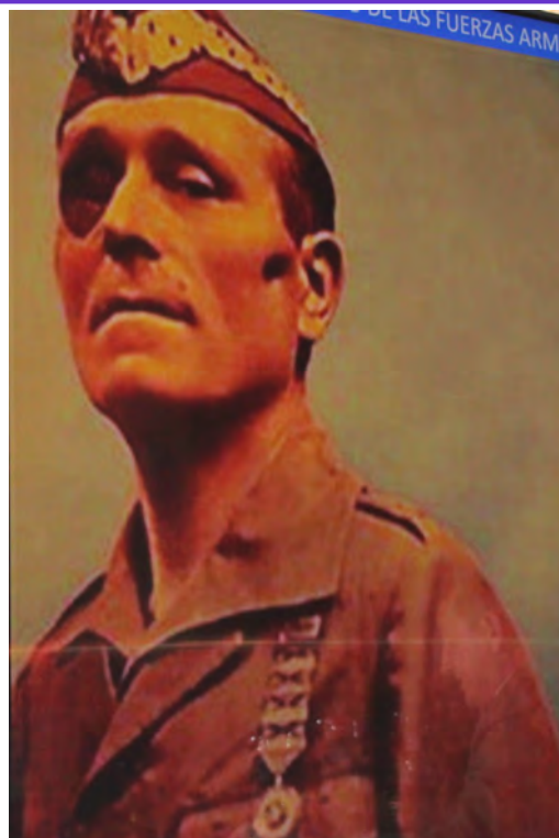
José Millán Astray

Ellos sabían que la única forma posible de mandar a los bravos soldados españoles es con el ejemplo. Déjenme leerles unos breves versos, tranquilos que no son míos y además son muy bien conocidos, los escribió otro soldado de Flandes, Pedro Calderón de la Barca , otro soldado de los Tercios allí en tierra de herejes, reflejando el único modo de mando que entendían los soldados del emperador, “ y aquí, de modestia llenos, a los más viejos verás, tratando de ser lo más y de parecer lo menos” . Se sirve, se manda con el ejemplo, porque hacia el mando tornarán las miradas cuando, en momentos inciertos, se precise de la seguridad que aporta el conocimiento, la experiencia y la autoridad de aquel que dirige. De ahí la relevancia que los soldados damos al Mando Supremo a aquel que ha recibido el mandato de la nación para encabezar esta noble profesión de las armas.