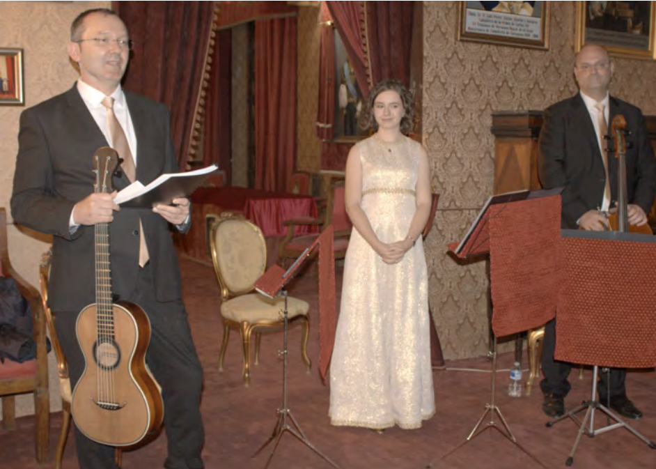
Introducción musical del Grupo Plaisir D´Amour

Y fue primer Hermano Mayor de nuestra Real Maestranza de Caballería de Zaragoza desde diciembre de 1819 a agosto de 1865. No me alargo más, a continuación vamos a escuchar a este estupendo grupo musical.