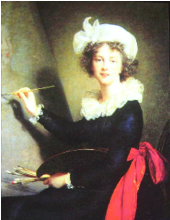
Elisabeth Vigée Le Brun