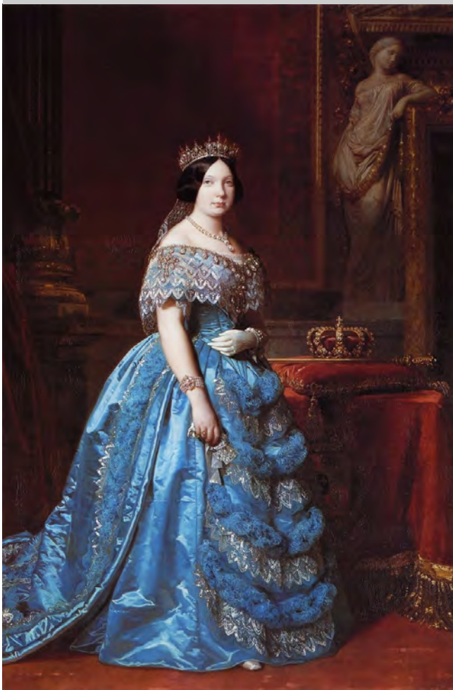
Retrato de Isabel II de España

Ella fue una de las primeras grandes artistas europeas, de origen francés, Estas ideas de progreso en el siglo XIX permiten en España entablar un debate público sobre otras cosas, pero de forma particular sobre la enseñanza femenina, qué era lo que debían aprender las mujeres de nuestro país, tanto la calidad de esa enseñanza que debían recibir como qué tipo de materias debían aprender. Esto permitió una mejora de la educación empezando por la obligatoriedad de enseñanza a las mujeres a mediados del siglo, que permitió dar mayores herramientas en lo que respecta a la enseñanza artística para que las mujeres abandonaran ese aspecto amateur de lo que podía ser su afición a la pintura y tener las herramientas para dedicarse profesionalmente a ella.