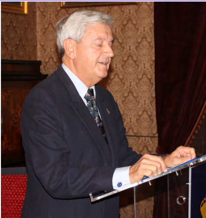
Teniente de Hermano Mayor de la RMCZ