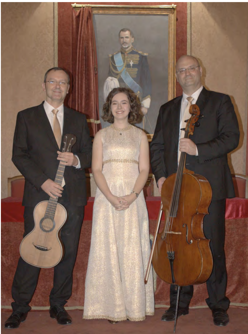
Grupo musical PLAISIR D'AMOUR

La Real Maestranza de Caballería de Zaragoza presentó en la capital aragonesa, con la brillantez a la que nos tiene acostumbrados, su Ciclo Cultural de Otoño 2025, un ciclo que se desarrolló durante los días 29 y 30 de septiembre y 1 de octubre, en la Casa-Palacio de esta reconocida y prestigiosa Corporación Nobiliaria. Todas las jornadas del ciclo, precedidas de gran interés, tuvieron lugar en el regio Salón de Tenientes, a partir de las 19.00 horas, registrando una gran afluencia de público.