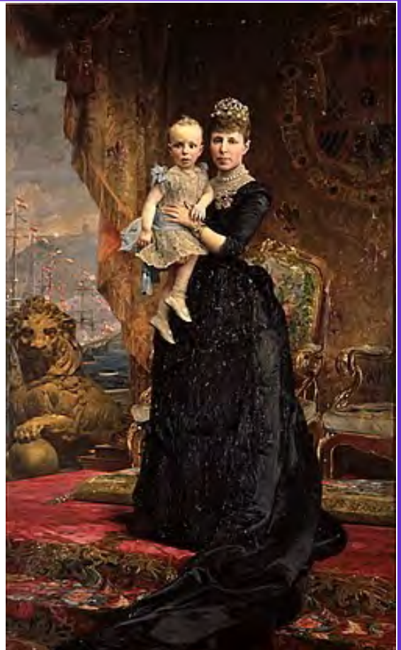
Retrato de Mª Cristina de Absburgo-Lorena y Alfonso XIII