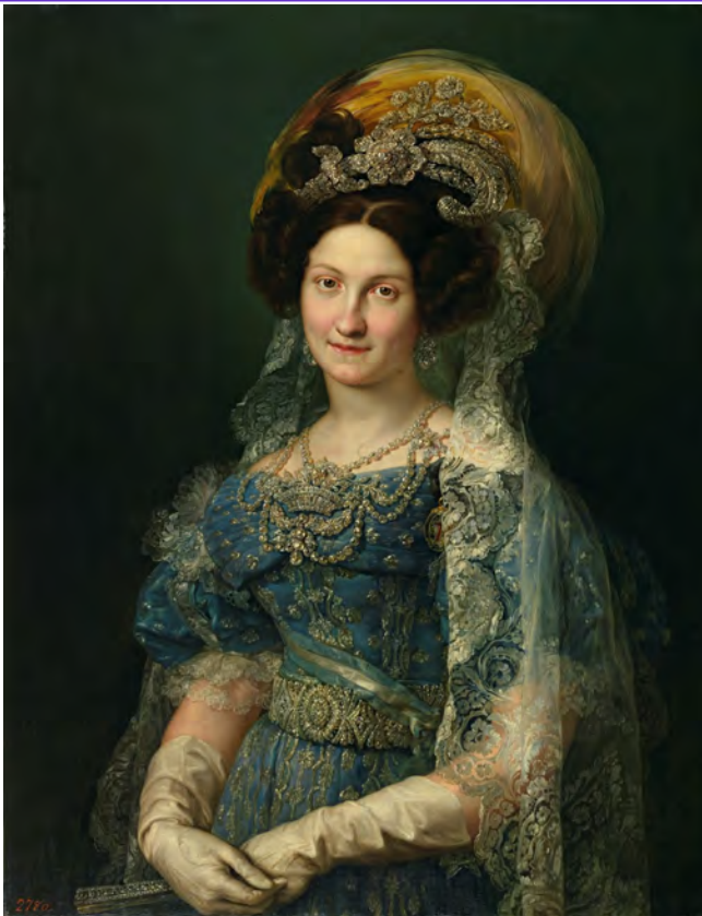
Retrato de María Cristina de Borbón