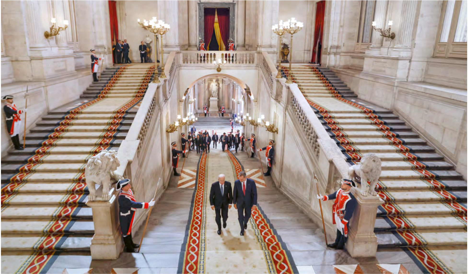
El Rey recibe en el Palacio Real al presidente de los Estados Unidos, Joe Biden, antes del inicio de la XXXII Cumbre de la OTAN, celebrada en Madrid para conmemorar el 40 aniversario de la adhesión de España a la Alianza Atlántica, 28 de junio de 2022.