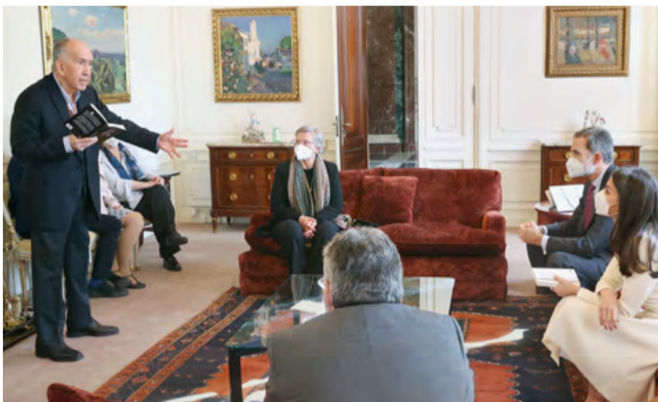
El poeta Joan Margarit lee algunos de sus poemas ante los Reyes tras recibir el Premio de Literatura en Lengua Castellana Miguel de Cervantes 2019 en un acto privado celebrado en el Palacio Albéniz de Barcelona el 21 de diciembre de 2020, que había sido pospuesto a causa de las restricciones por el coronavirus.