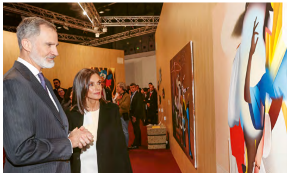
Los Reyes presiden la inauguración de la 43.ª Feria Internacional de Arte Contemporáneo-ARCOmadrid, pieza imprescindible en el circuito internacional de promoción y difusión de la creación artística, 6 de marzo de 2024.