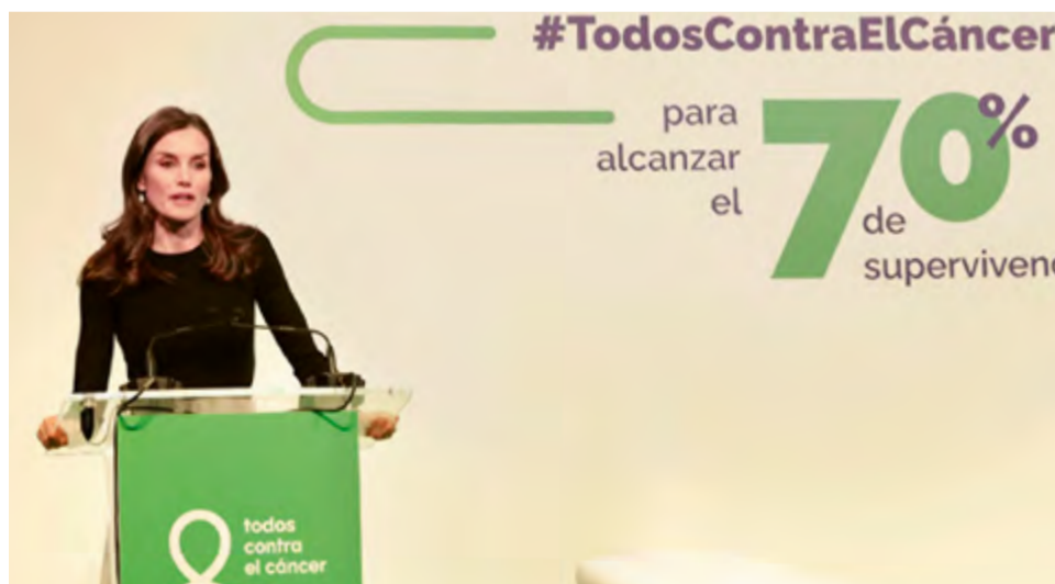
La Reina Letizia, que se ha centrado en apoyar causas como la educación, la investigación científica, la salud mental y la lucha contra el cáncer, preside el acto de presentación del proyecto «Todos contra el cáncer» de la AECC, 2 de febrero de 2023.