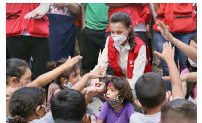
La Reina visita el albergue instalado en el Instituto Patria de La Lima durante su viaje de ayuda humanitaria a Honduras, 16 de diciembre de 2020.