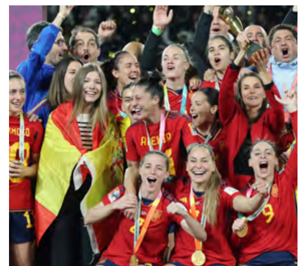
Uno de los rasgos que caracteriza a la Familia Real española es su pasión por el deporte y su apoyo a nuestros deportistas. Fieles a ese compromiso, el Rey quiso animar desde las gradas a Rafael Nadal, que alcanzó su decimocuarto título de Roland Garros el 5 de junio de 2022, y la Reina y la Infanta Sofía celebraron con la selección femenina de fútbol el triunfo en la Copa Mundial disputada en Australia y Nueva Zelanda, 20 de agosto de 2023.