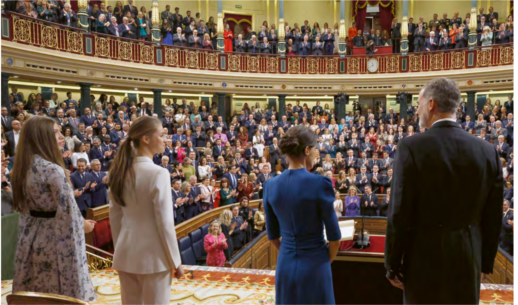
El día de su 18 cumpleaños, la Princesa de Asturias prestó juramento de acatamiento a la Constitución Española como heredera formal de la Corona ante el pleno de las Cortes Generales, reunidas en sesión conjunta del Congreso de los Diputados y del Senado, 31 de octubre de 2023.