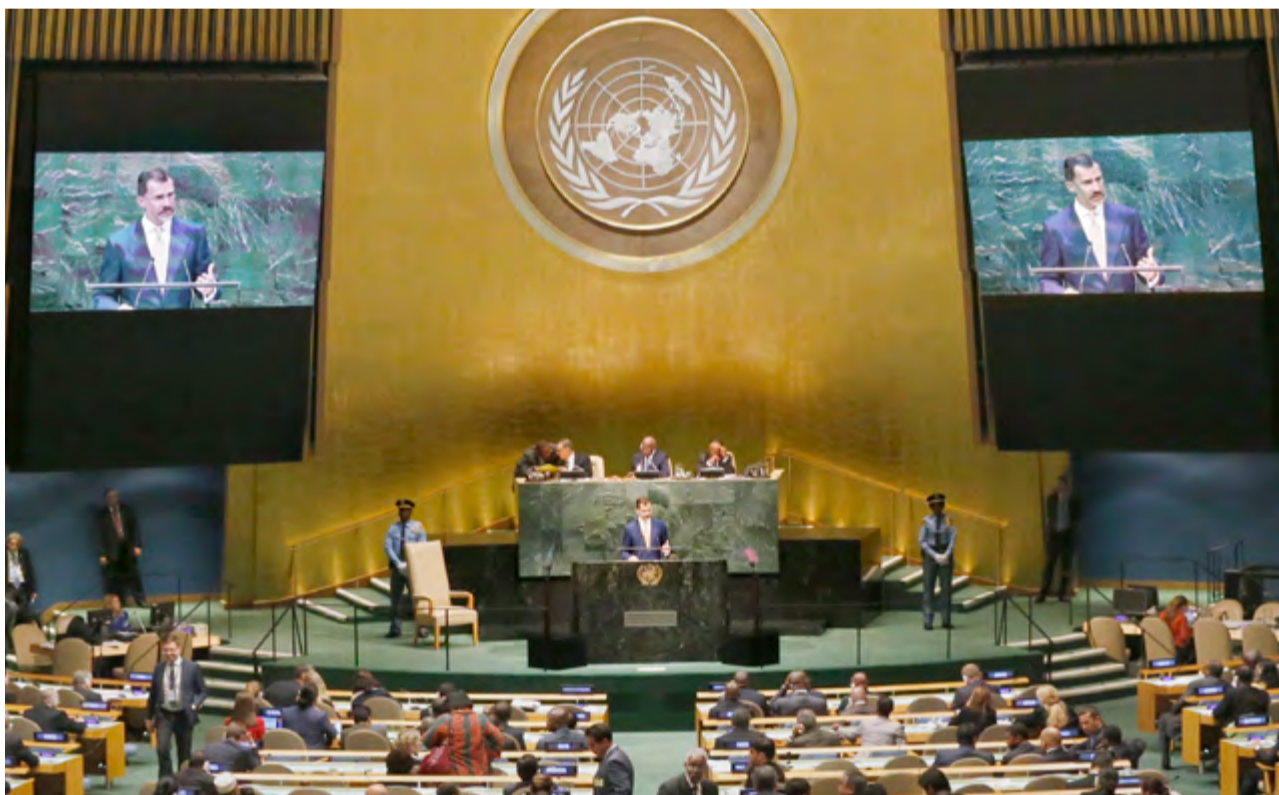
Felipe VI interviene en la Cumbre de las Naciones Unidas sobre el Desarrollo Sostenible celebrada en Nueva York, en la que se aprobaron los 17 Objetivos de Desarrollo Sostenible que el mundo debería alcanzar en los siguientes 15 años, 25 de septiembre de 2015.