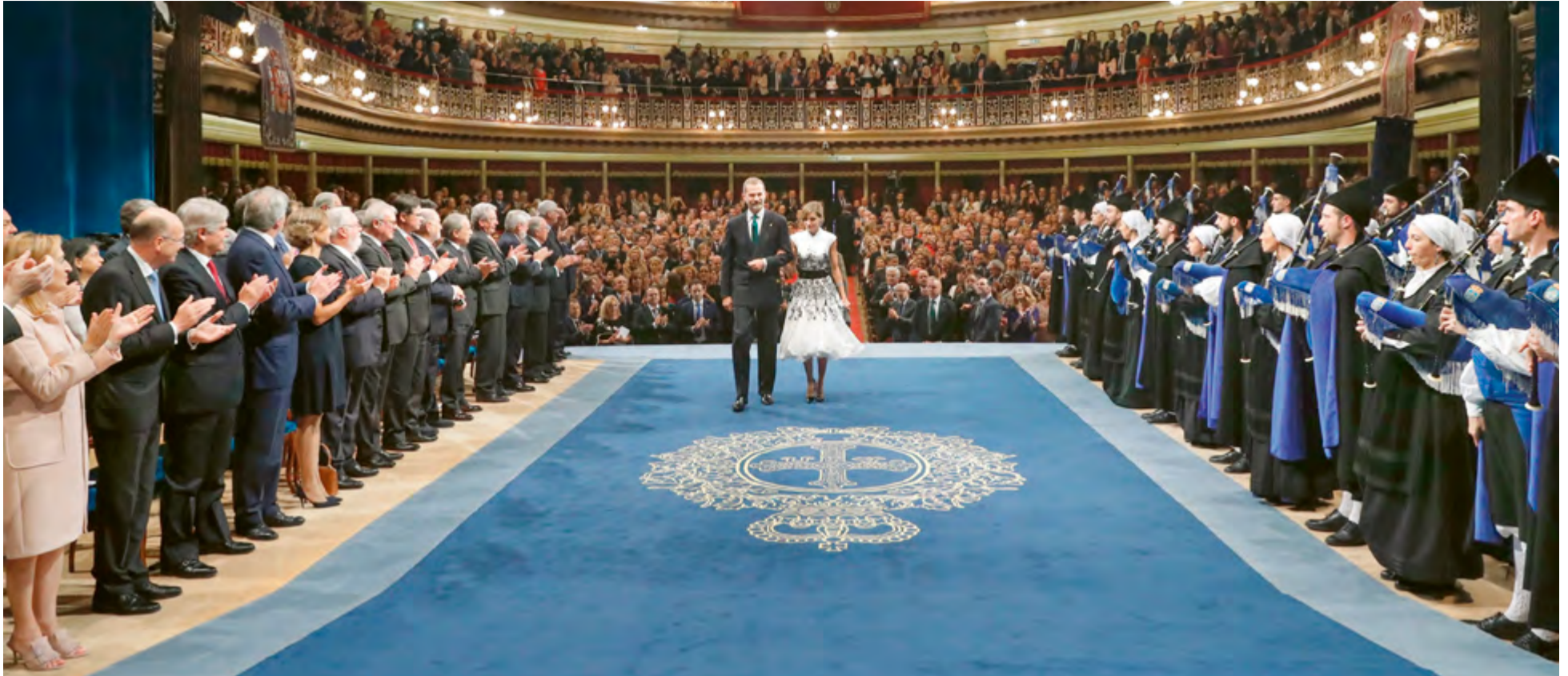
Los Reyes presiden la entrega de los Premios Princesa de Asturias en la ciudad de Oviedo, 20 de octubre de 2017. En el 60 aniversario del Tratado de Roma, la Unión Europea recibió el Premio de la Concordia. Recogieron el galardón de manos del Rey los presidentes de sus tres instituciones fundamentales: Antonio Tajani, del Parlamento Europeo; Donald Tusk, del Consejo de Europa; y Jean-Claude Juncker, de la Comisión Europea.